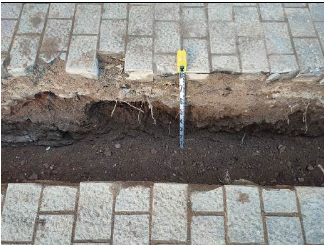
8. Estratigrafia documentada.