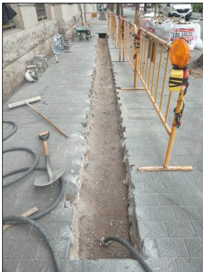
5. Extracció dels panots i el planxé de formigó.

Memòria de la intervenció arqueològica al carrer del Portal de Santa Madrona, 14-22/ avinguda de les Drassanes, 3-7. Codi 115/22.