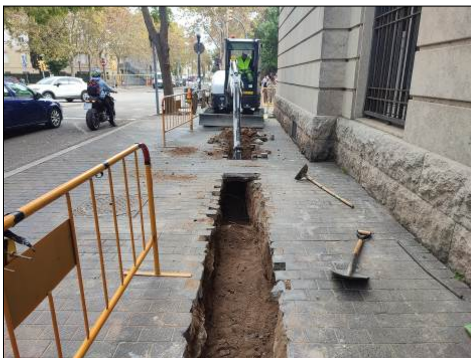
6. Excavació de la UE 103 amb màquina.