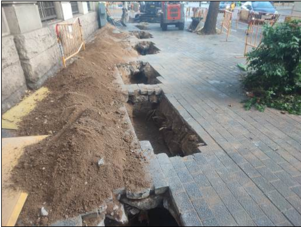
11. Tram de la rasa del carrer del Portal de santa Madrona un cop excavat.

Memòria de la intervenció arqueològica al carrer del Portal de Santa Madrona, 14-22/ avinguda de les Drassanes, 3-7. Codi 115/22.