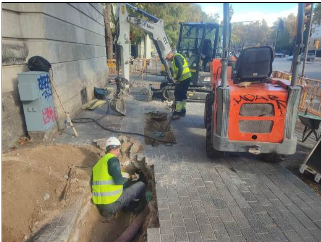
10. Tram de rasa del Portal de Santa Madrona en procés d'excavació.