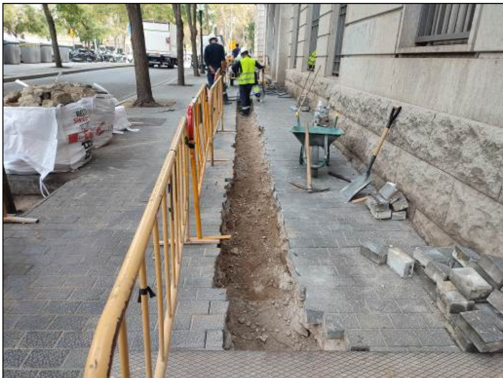
4. Extracció dels panots i el planxé de formigó.