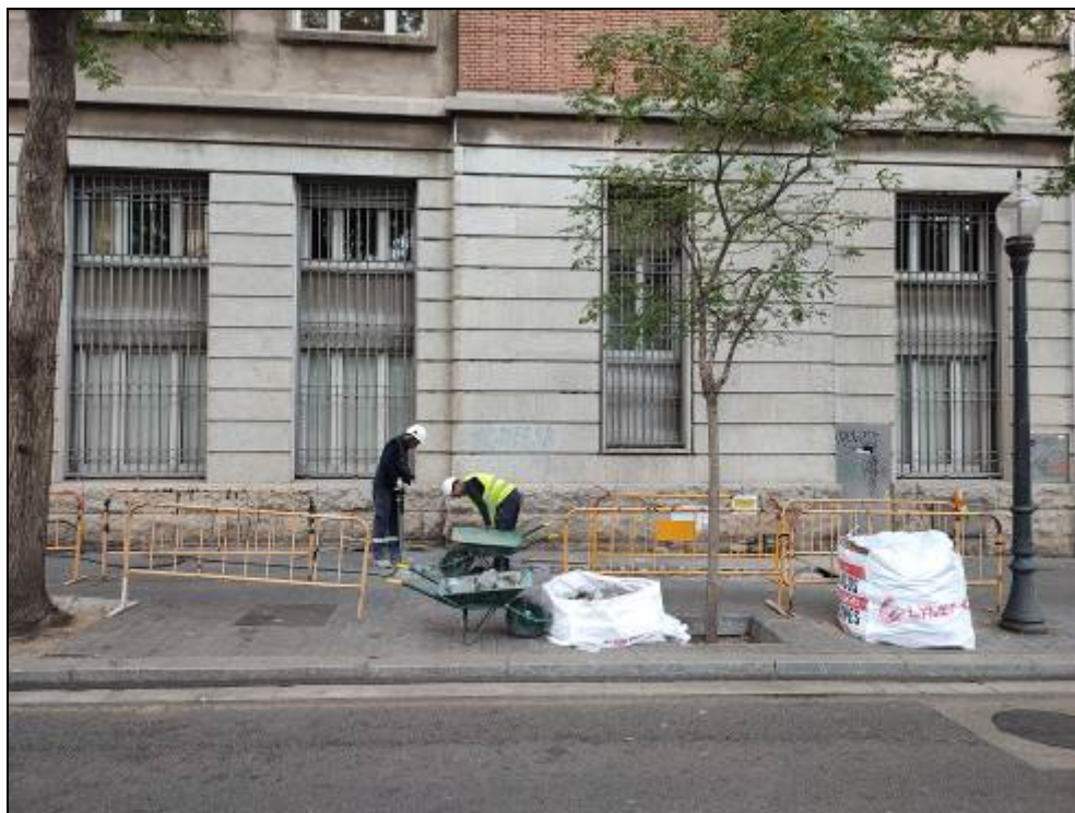
2. Inici dels treballs.