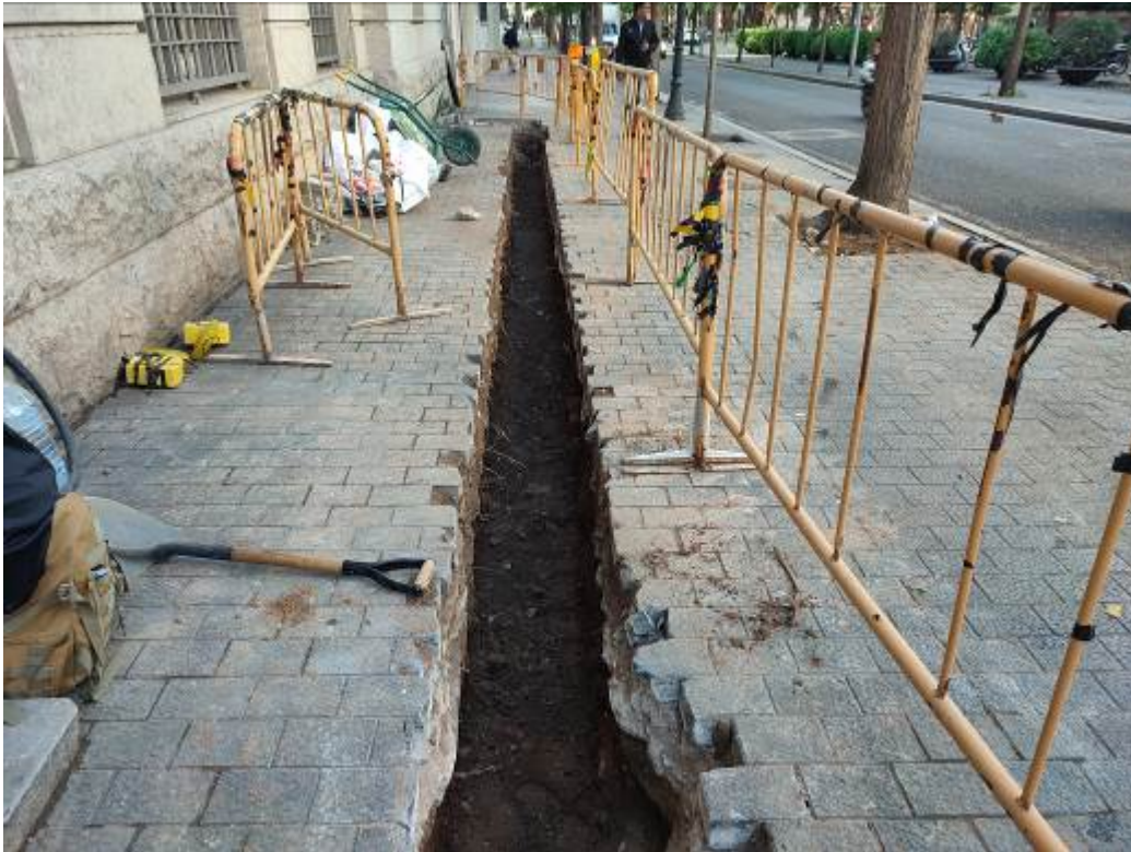
7. Tram de rasa de l'avinguda de les Drassanes un cop excavat.