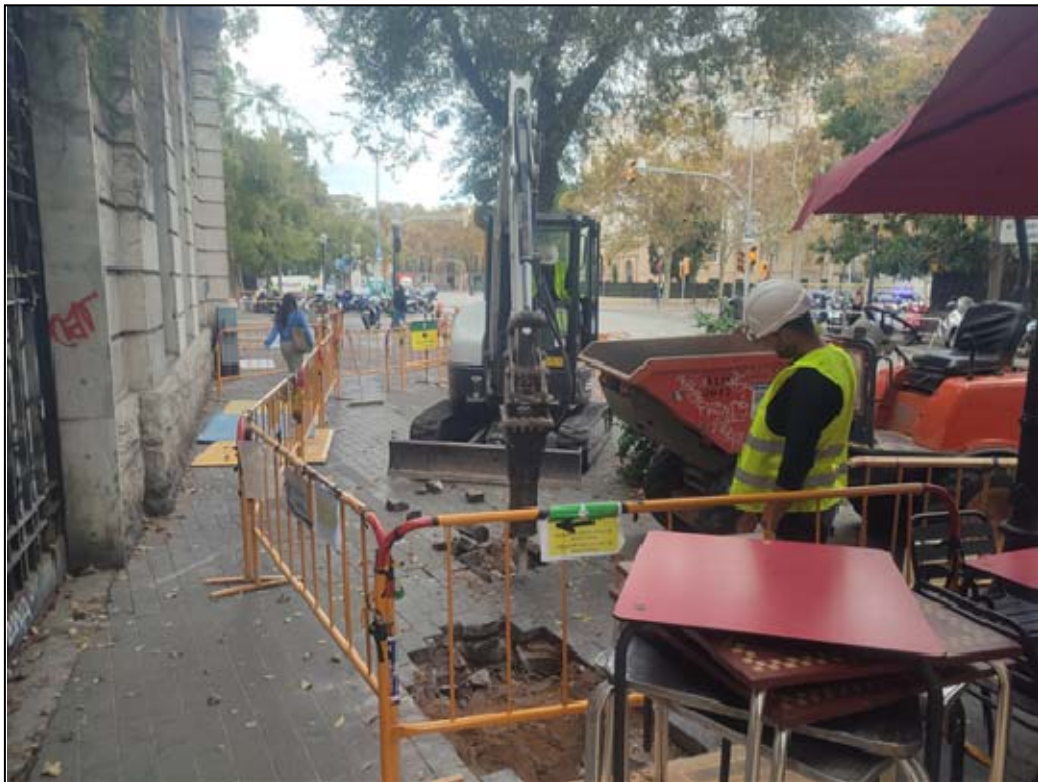
9. Tram de rasa del Portal de Santa Madrona en procés d'excavació.