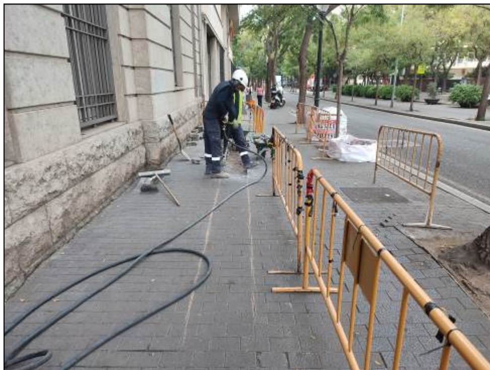
1. Inici dels treballs.