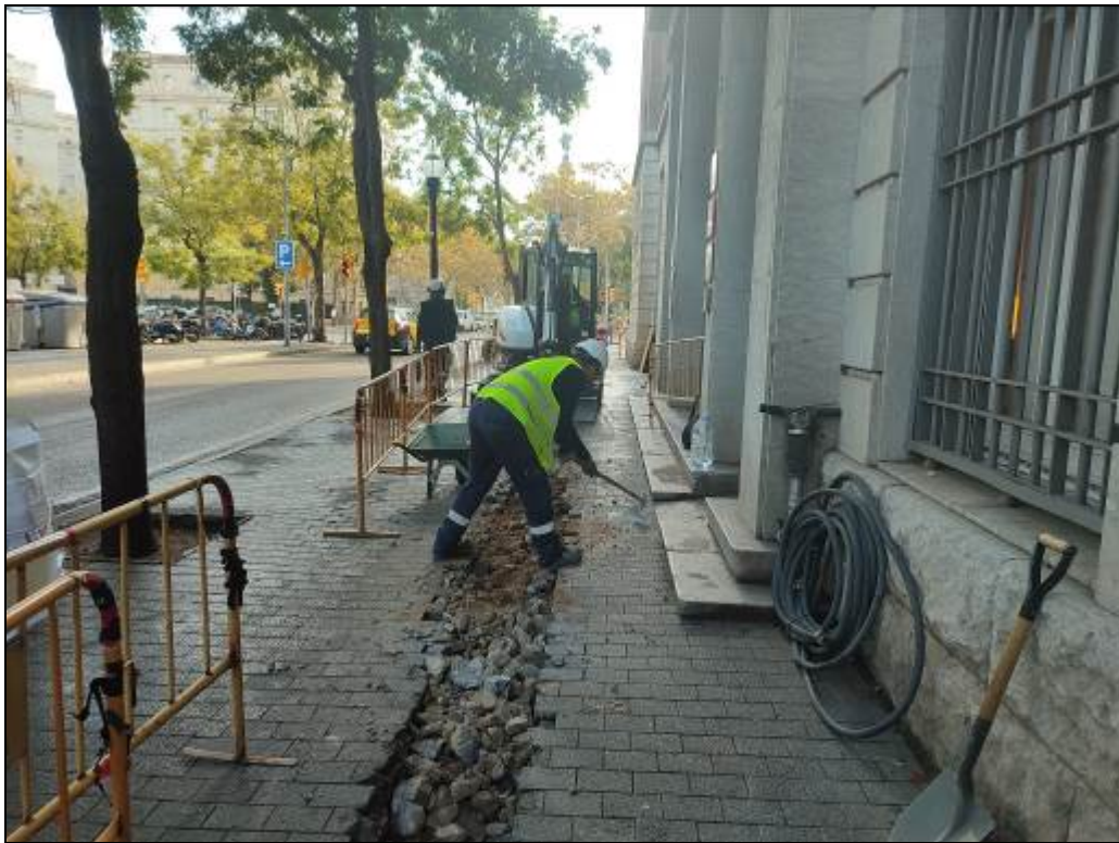
3. Extracció dels panots i el planxé de formigó.